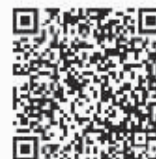
抗战纪念七碑 二维码