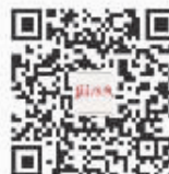
盐阜大众报 微信二维码