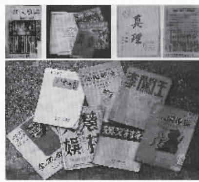
在盐阜区出版的熏染着硝烟的文化作品。

受陈毅的委派，葛洪波主持文化村的工作。陈毅、黄克诚、张爱萍等新四军领导人和华中局宣传部长彭真及文艺书记钱俊瑞等经常到文化村看望大家，关心文化工作者的居住和安全，并同他们纵论天下，高谈阔