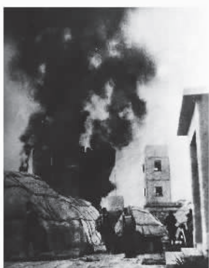
陈家港日军司令部炮楼被新四军击中起火。

从应打、到反攻，最后取得胜利，处于日寇军事夹击之间的新四军在盐城地区纵横驰骋，浴血奋战，发动一场场战斗，有力打击了敌人。