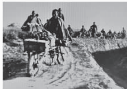
1944年5月，陈家港战斗结束后，群众帮助新四军运送战利品。

人当选“中国好人”，人数位居全省首位，形成了“人人有好人”的“盐城现象”。近三年来，盐城累计19人荣获“中国好人榜”，11人的道德土壤不断长出美德之花，“厚德盐城”品牌效应进一步彰显。