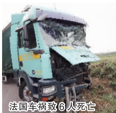
法国车祸致6人死亡

临时宪法要求成立人数不超过220人的立法议会，代替国会上下两院的工作，担任立法议会成员的人选需3年内未在任何政党中担任职务。此后，将由立法议会投票产生并由国王任命一名总理，成立不超过35名内阁成员的临时政府。