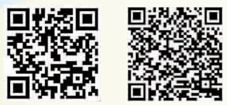
镇江日报新浪微博二维码 镇江论坛