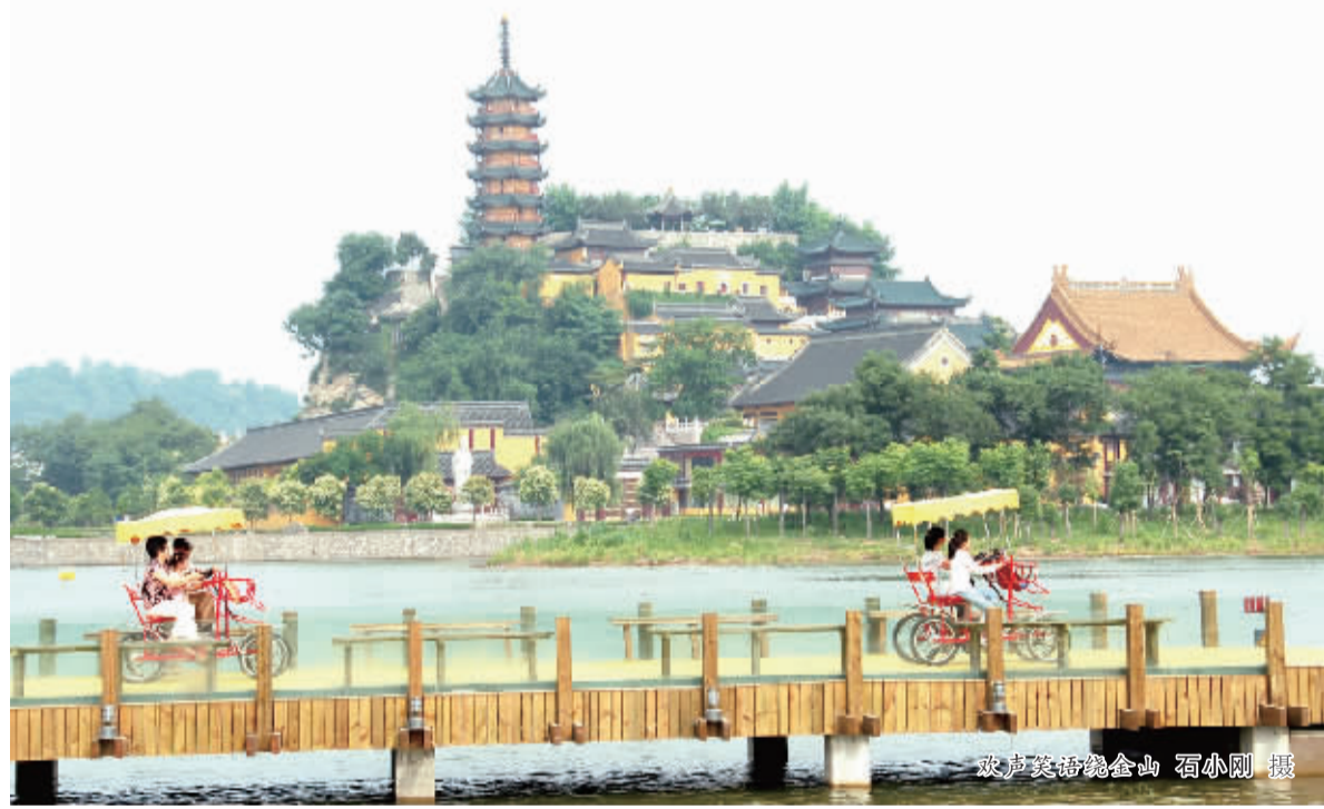
波光粼粼金山