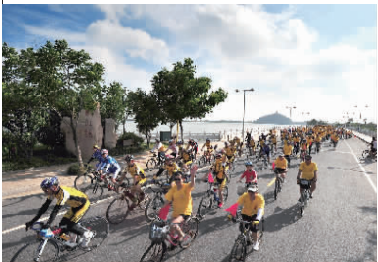
骑行在滨水大道