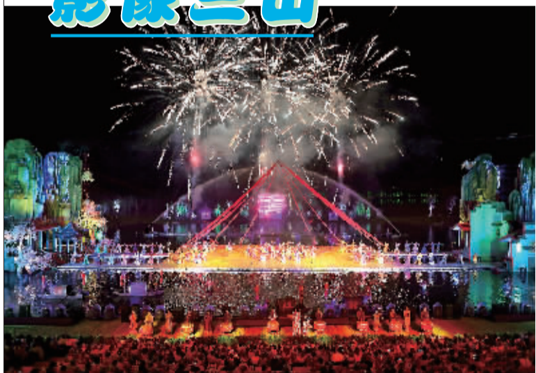
绚丽缤纷水景秀