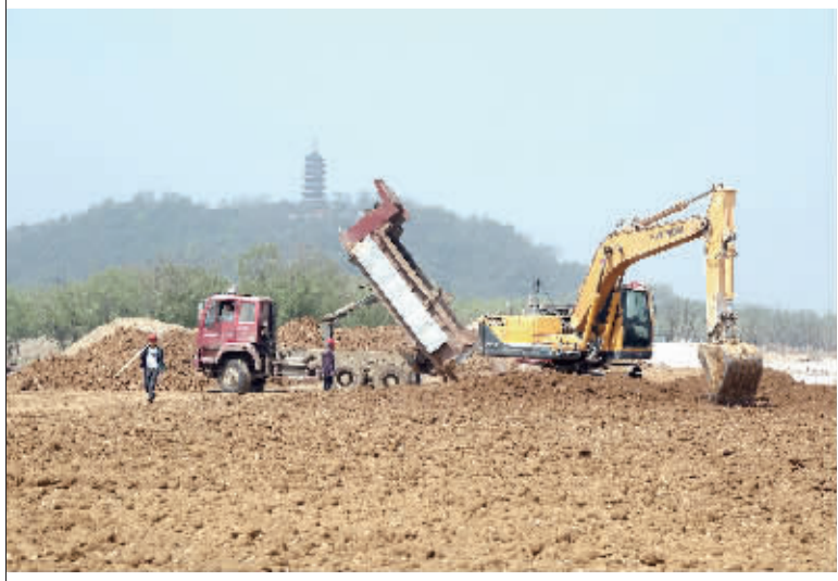
正在施工的京江路工程