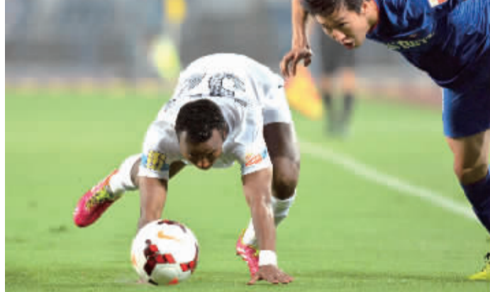
编辑/栾继业 版式/翟志伟 校对/杨庆丰