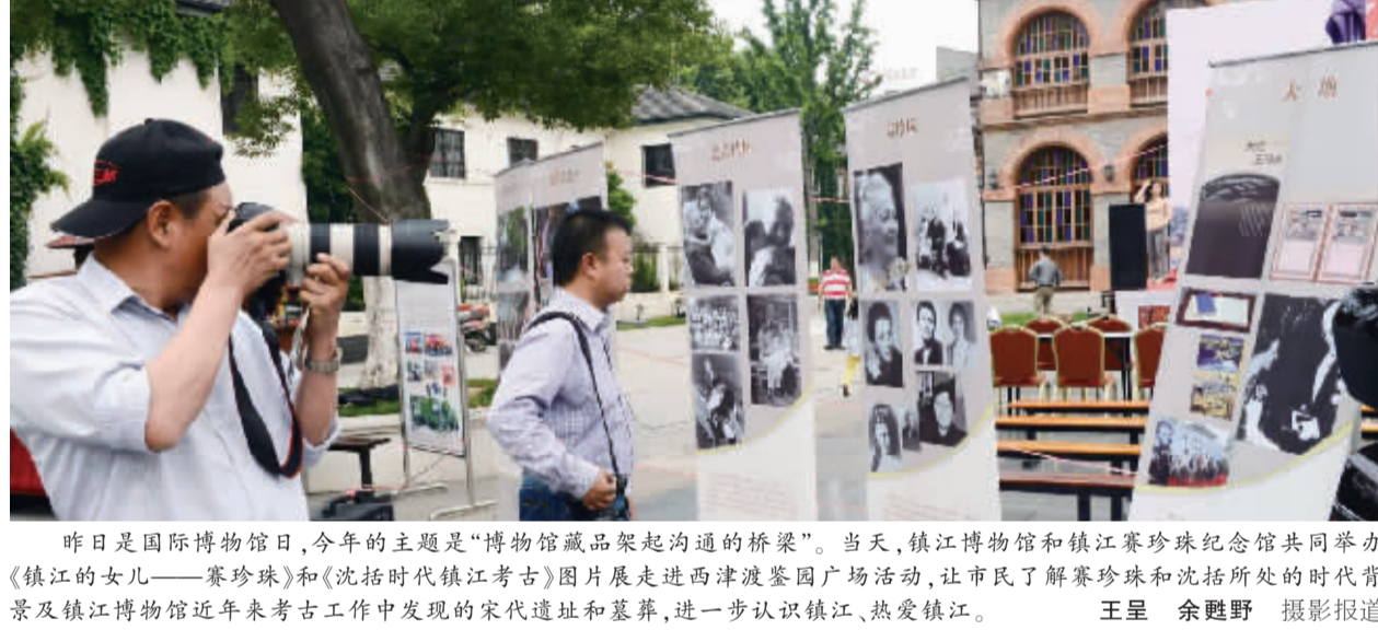
昨日是国际博物馆日,今年的主题是“博物馆藏品架起沟通的桥梁”。当天,镇江博物馆和镇江赛珍珠纪念馆共同举办《镇江的女儿——赛珍珠》和《沈括时代镇江考古》图片展走进西津渡景区广场活动,让市民了解赛珍珠和沈括所处的时代背景及镇江博物馆近年来考古工作中发现的宋代遗址和墓葬,进一步认识镇江、热爱镇江。