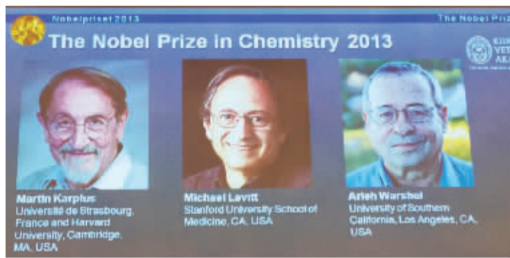
10月9日，在瑞典首都斯德哥尔摩，诺贝尔化学奖颁奖仪式现场播放的幻灯片显示2013年诺贝尔化学奖得主照片。

诺贝尔化学奖评选委员会在当天发表的声明中说，如今对化学家来说，电脑同试管一样重要，计算机对真实生命的模拟已成为当今化学领域中大部分新研究成果成功的关键因素。科学家可以用电脑来揭开复杂的化学过程，例如催化剂对废气净化或者绿叶的光合作用等，通过模拟，化学家能获得比传统实验