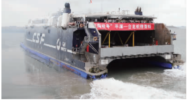
10月9日，“海峡号”从福建平潭澳前码头首航开往台北。当日，“平潭—台北”航线正式开通，这是台北港首度启动客运服务机制，同时也是大陆籍客轮首次开进北台湾，标志着两岸间核心的黄金水道正式连通。