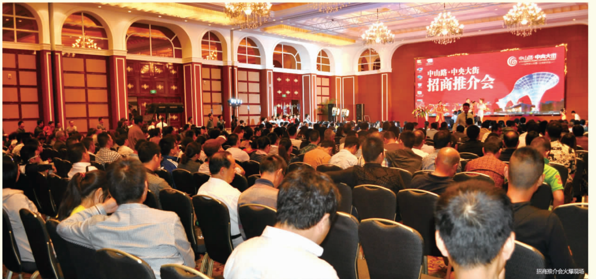
招商推介会火爆现场