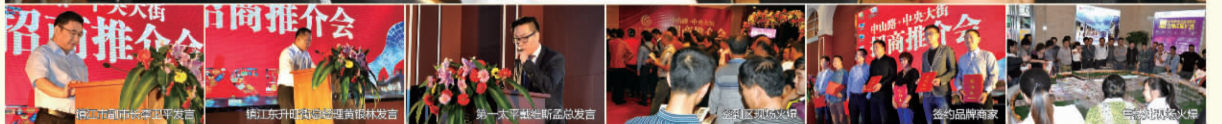
镇江市副市长李卫平发言