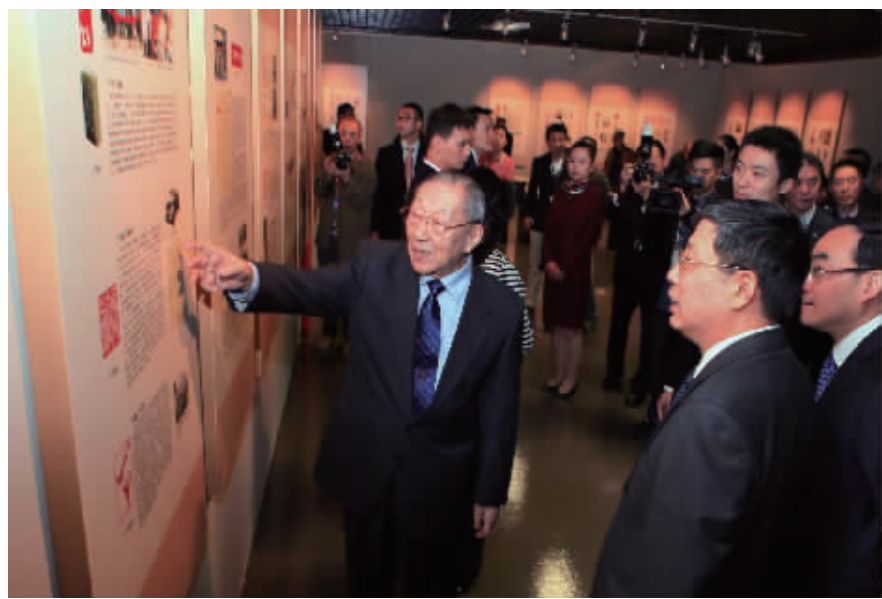
李岚清同志介绍篆刻作品