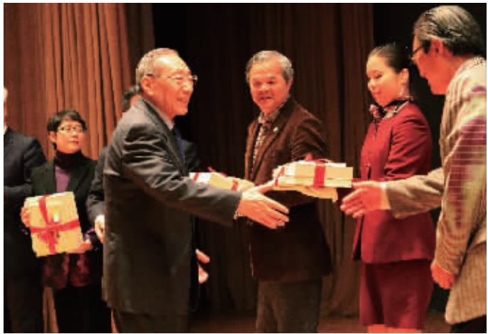
“李岚清篆刻书法素描艺术展”开幕式赠书现场

开幕式后,中国印文化促进会(筹)组织了现代篆刻艺术研讨活动,我市篆刻艺术推广协会秘书长范德平、绍兴兰亭印社社长陈扬分别介绍了现代篆刻推广情况,范德平重点介绍我市举办现代篆刻五项技能大赛的情况。现代篆刻,是老领导李岚清同志提出的一个新的篆刻理念,这个理念的核心就是把电脑技术、数控技术运用于印章的设计制作,使篆刻由“小众欣赏”成为“大众艺术”。另外我市同心印、祝寿印的开发和现代篆刻艺术与园林景观的结合,也引起了与会者的广泛兴趣。