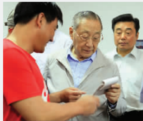
●观看职业篆刻师的印谱。