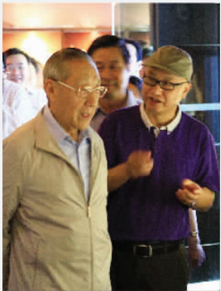
●听取我市篆刻创作成果介绍。

2014年5月31日下午,李岚清同志来到镇江朱方印社(镇江市篆刻艺术推广协会)参观视察,饶有兴趣。其间,与大家进行了座谈。下面就是他围绕篆刻艺术所畅谈的一些感想。