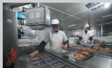
现代化包装(步骤四)