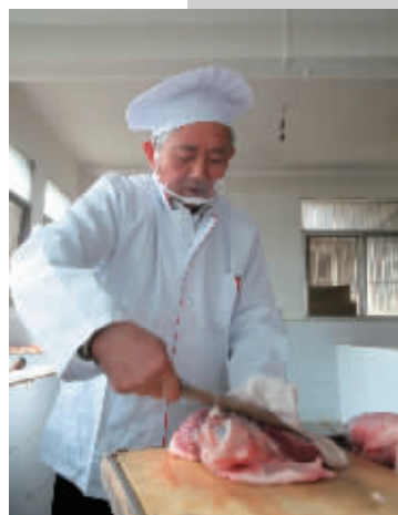
刀工处理“开蹄子”1(步骤一)