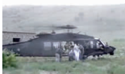
当地时间6月4日，由塔利班公布的视频显示，塔利班人员在阿富汗东部将身着阿富汗传统服饰的伯格达尔移交给美军，伯格达尔坐在车内，十多名手持冲锋枪的塔利班武装人员在周围看守(上图)。随后伯格达尔登上一架美军直升机离开(左图)。