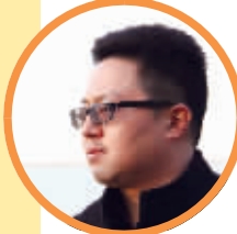
蹲点记者：沈湘伟(机动部副主任)

社区工作人员介绍，社区“四老”是全体社区居民的榜样，无论是慈善捐款、赈灾助贫、资助弱势群体，还是参加义务巡逻、调解邻里纠纷、倡导文明新风等，都是全体居民的表率，值得大家学习。(沈湘伟)