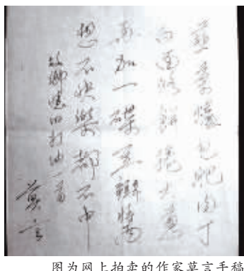
图为网上拍卖的作家莫言手稿