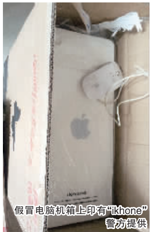
假冒电脑机箱上印有“ikhone” 警方提供