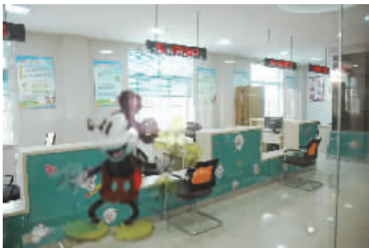
即将投入使用的儿童门诊大厅。