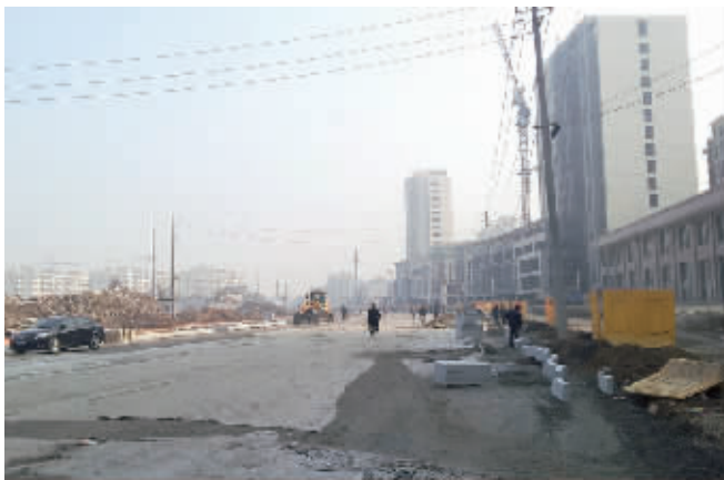
学府路三期施工现场

记者在学府路改造现场看到，道路大体框架已经显露。有滚轮车在人行道位置填土碾压，为后续的混凝土浇筑做好准备。而用于机非分隔的路沿石已经开始一段段砌筑。项目部负责人告诉记者，上周开始学府路三期就对机