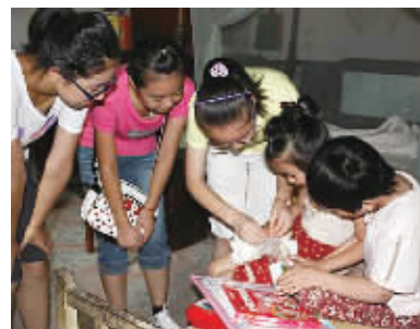
志愿者们为小黄辅导功课