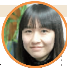
蹲点记者：杨冷 (新闻策划部记者)