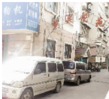
社区代管物业的梦溪花苑