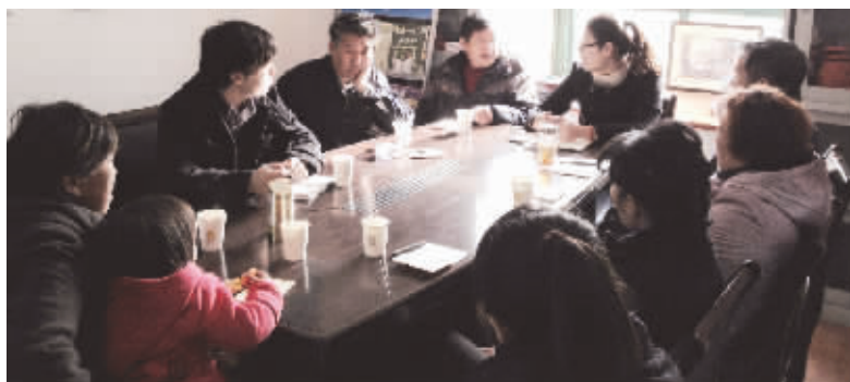
“阳光智囊团”成员在交流

考虑到社区事务层次多,又繁杂,社区在智囊团成员的选取上,吸收了大学生村官、社区党员、社区工作人员等不同群体成员,通过多层次、多视角、多看法摸查片区居民日常生活中的困难情况,反馈到社区集中处理解决。另外,智囊团还会定期轮换成员,为更多居民提供“谋士”之位,也便于吸收各家之言,更好地服务居民,提升社区生活质量。