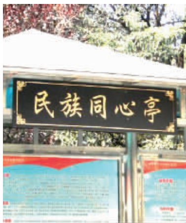
民族同心亭 张兆勇 摄

“社区先后成立了‘民族同心工作室’、‘民族同心宣传画廊’、‘民族同心流动展牌’、‘民族同心亭’等。”李慧青表示,社区“民族同心工程”开展时间只有一年多,接下来社区准备投入更多的精力,努力做好少数民族群众的服务工作,达到和谐相处,共同发展。(张兆勇)