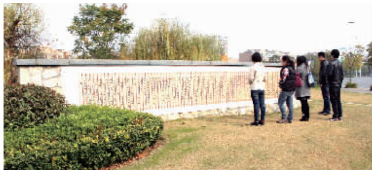
社区居民在“幸福宣言墙”前