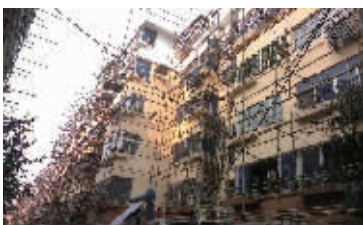
白莲巷片区综合整治现场

昨天记者从健康社区了解到,白莲巷片区环境综合整治力度我市“前所未有”。整治涉及105幢居民楼。自9月份启动以来,前期33幢的整治成效初显,不久即将完工。“改造之前,这里的居民楼呈现一片灰色,杂乱又暗淡,改造之后,前后对比真的很强烈。”当地居民说。