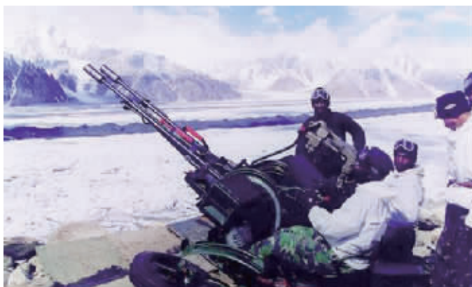
印度高原高炮部队正在进行射击训练