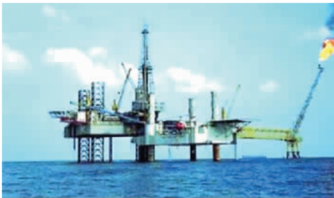
越南位于南海上的石油钻井平台。

与此同时，印媒则在强调这次访问背后的“南海因素”。《印度时报》19日称，“越南非常感谢印度在南海问题上的建设性角色”。《印度教徒报》当天报道称，印越在南海的合作项目