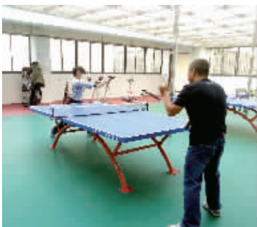
万科社区健身中心

“乒乓……乒乓……”昨天下午4点, 记者刚走进万科社区办公楼, 就听到一阵阵的乒乓球击打声。循着球声, 万科社区的健身中心映入眼帘——这是一个占地200多平方米的“阳光房”, 夕阳正从三面墙体上的十几扇窗户中洒落下来。这个“阳光健身房”里, 地面全铺设着塑胶, 除了2个乒乓球台外, 还摆放着七八件健身器材, 不少居民正