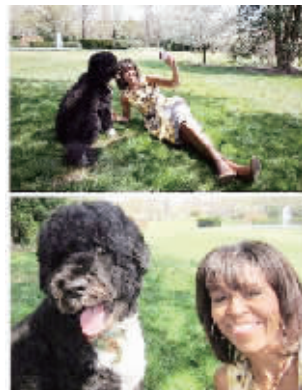
美国第一夫人米歇尔和她的“波”

“Selfie”也衍生出许多类似的字,如“helfie”意指自拍头发,“belfie”为自拍臀部,“drelfie”则是拍下自己