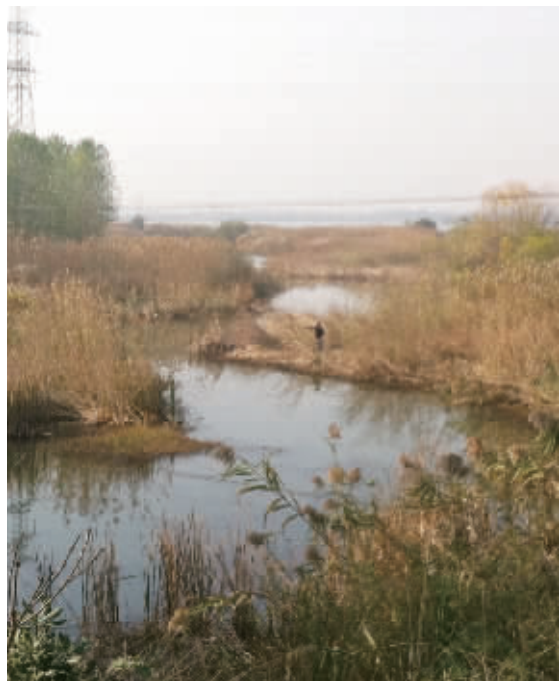
苏庆承包的池塘。

昨天，正常上班的李扬，接到了大学同学从常州打来的电话，“我同学让我在句容找一个好一点的农家菜馆，最好有钓鱼的地方，他周末要带几个同事过来，休闲放松一下。”