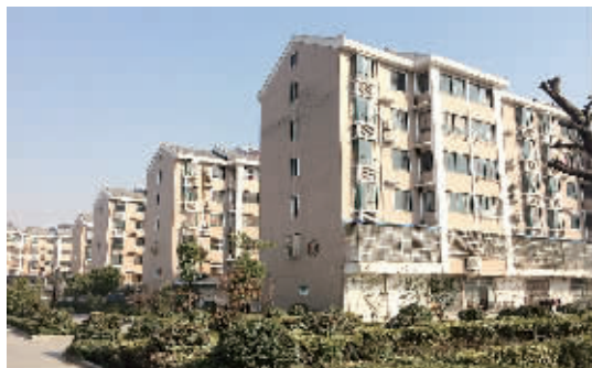
金桥新村