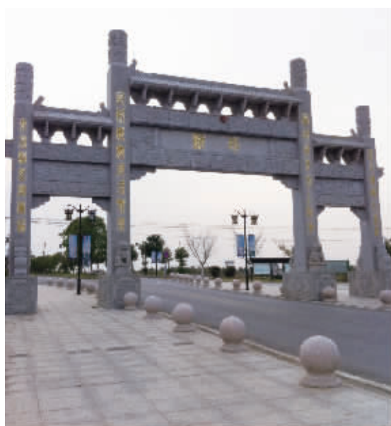
新坊村的特色牌坊。