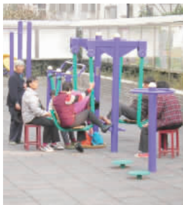
居民在安置小区里锻炼