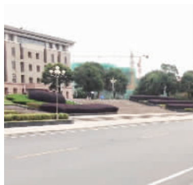
丹徒新城干净的街道

锻炼和跳舞的人络绎不绝。韩维维称,以江苏省大港中学为中心的,从幼儿园、小学、初中到高中的配套教育完善,十里长山大学城也正在加紧建设。区人民医院、中医院、文化馆、图书馆、农贸市场、城市酒店、农工商超市等城市配套设施已经形成,风景城邦、驹马山庄、魏玛假日、临湖尚郡、永安新城等一大批建成的生活小区,以独特的生态特色,为丹徒新城增添了一道亮丽的风景线。(记者 孙晨飞)