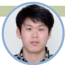
蹲点记者:孙晨飞 (民生新闻记者)