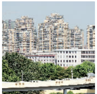
据江西省南昌市房地产信息网数据显示，10月份南昌新建商品房成交量达58万平方米，是今年以来唯一超过50万平方米的月份，较9月份上涨25%。这是位于南昌市八一大桥附近的一处楼盘。