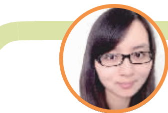
蹲点记者:施静静 (新闻策划部记者)