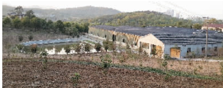
土地流转后建成的生态园