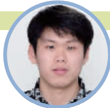
蹲点记者:孙晨飞 (民生新闻记者)

据了解,城东茗苑小区目前总共有776套安置房,现在办理了回迁安置入住的已有400多套。除了光明社区有一部分征迁村民外,还有驸马庄社区一部分征迁村民也安置在此。(记者 孙晨飞)