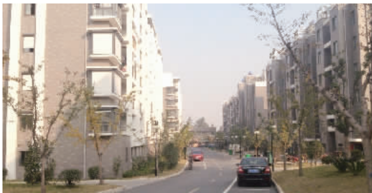
城东茗苑小区环境

今年已经57岁的冯红生,一直给人打工,辛苦了很多年。如今生活富足,他就想着在家好好歇歇。“其实我很感谢丹徒新城的开发建设,要不是有这个机遇,我也不会有像现在这么好的日子。”冯