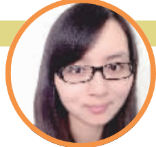
蹲点记者:施静静 (新闻策划部记者)