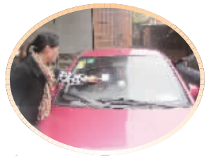
徐梅发现字条的地方