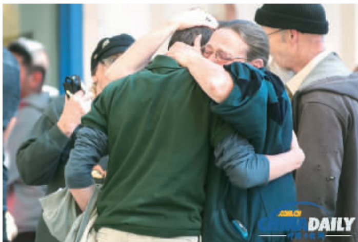
幸存者相互拥抱安慰