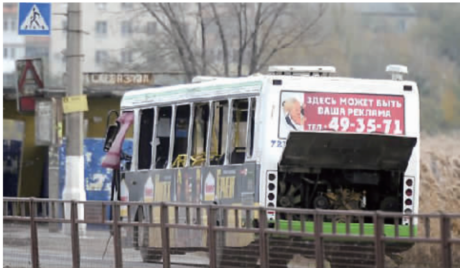
发生爆炸的公共汽车