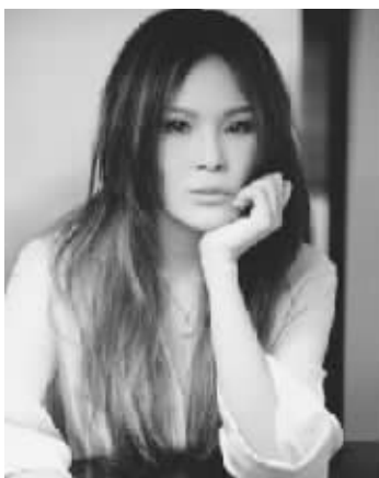
周蕙新专辑造型变美了不少