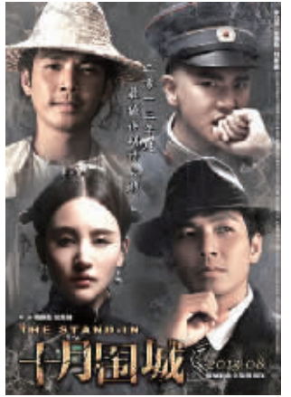
2013年末期待到的《十月围城》，等着2014年与观众见面