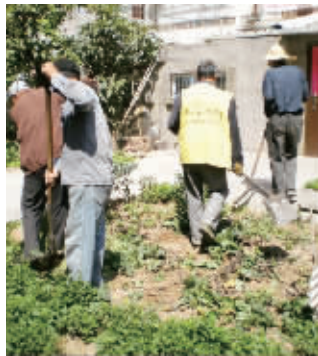
街道城管清理社区小菜园